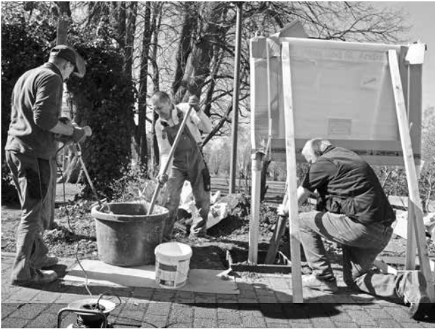
Der erste richtig schöne Tag wurde genutzt, um den Schaukasten aufzustellen.

Ach, ist Ihnen auch der neue Schaukasten aufgefallen? Wenn es dunkel ist und Sie noch einmal nachschauen wollen, wann der nächste Gottesdienst beginnt oder wann welche Gruppe sich das nächste Mal